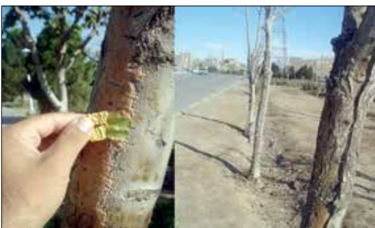
شکل ۲: سرخ شدن تنه درخت در اثر آفتاب سوختگی

گیاه برای مقاومت بیشتر در برابر آفتاب سوختگی، برخی از سلول‌های در معرض نور خورشید را از فرم فتوسنتز و تولید به فرم غیر زنده فیبری و چوبی (در تنه‌ها و شاخه‌ها) یا چرمی و ضخیم (در برگ‌ها) تبدیل می‌کند. این سلول‌ها صرفاً نقش محافظتی داشته و معمولاً به رنگ نقره‌ای تغییر رنگ می‌دهند تا بتوانند انعکاس نور خورشید را داشته باشند. به همین دلیل برگ درختان بصورت چرمی و نقره‌ای رنگ شده و در تنه چنین درختانی بافت چوبی و لایه محافظتی ایجاد می‌شود. در چنین شرایطی رشد بقیه قسمت‌های گیاه تحت تأثیر این واکنش، کاهش می‌یابد و در واقع گیاه بیشتر توان خود را برای عبور از این تنش مصرف می‌کند.