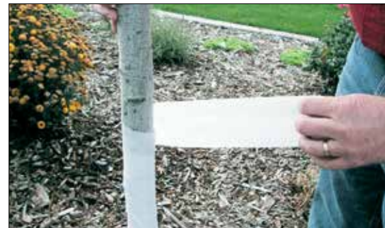
شکل ۱: عمود شدن و برگ‌گشت برگ‌های درخت سنجد با هدف کاهش تبخیر آب

گیاه برای افزایش قدرت ترمیم و جلوگیری از اثرات خسارت در قسمت‌هایی که در معرض مستقیم آفتاب هستند، شیره نباتی خود را به همراه آب فراوان را به این نواحی ارسال می‌کند. در داخل شیره نباتی ارسالی، میزان اسید آمینه و پروتئین‌های ضد استرس و ترمیم‌کننده افزایش می‌یابد. پروتئین و اسید آمینه به سرعت در اثر افزایش دمای محیط از حد آستانه از بین رفته و باعث مرگ بافت‌های سپر حرارتی (سلول‌های سطحی پوست) می‌گردد. به همین علت نواحی رو به آفتاب در درخت به رنگ سرخ تغییر رنگ می‌دهد.