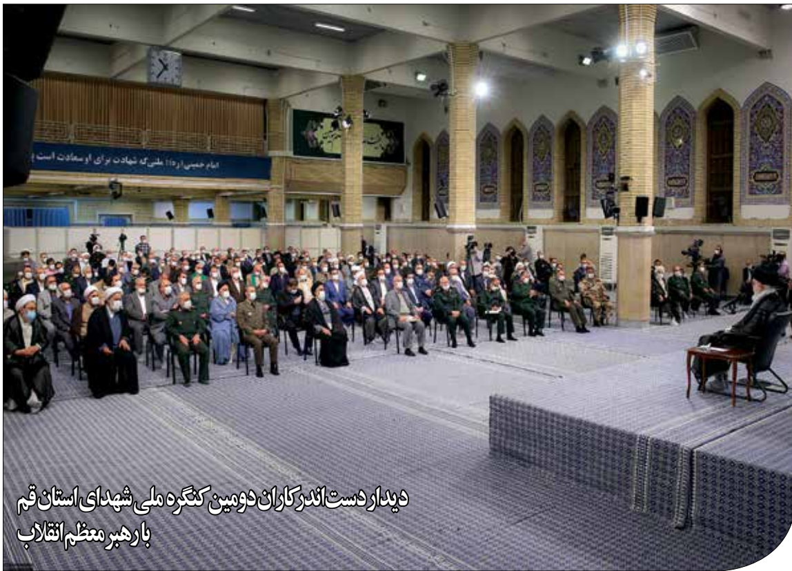
دیدار دست‌اندرکاران دومین کنگره ملی شهدای استان قم بارهبی معظم انقلاب

تنها در سال ۱۴۰۱ بیش از ۴۴۰۰ متر مربع تبلیغات شهری با موضوعات مرتبط در حوزه ایثار و شهادت و کنگره ملی شهدای استان قم صرفاً توسط شهرداری قم طراحی، چاپ و به اکران رسیده است. طراحی و اجرای پویش‌های تبلیغات محیطی به صورت منسجم و هماهنگ در تمامی سطح شهر قم از رویکردهای شهرداری قم در این زمینه بوده است و با هدف اثرگذاری بیشتر تلاش شد تا با استفاده از ظرفیت قالب‌های متنوع هنری و توان هنرمندان بومی استان قم، بیان پیام‌ها و اطلاع‌رسانی‌های مرتبط در زمینه ایثار و شهادت و برنامه‌های مختلف کنگره شهدا و اجلاس‌ها و یادواره‌های مرتبط پیگیری شود. با توجه به اهتمام مجموعه مدیریت شهری در همراهی، حمایت و مشارکت با دستگاه‌ها، نهادها، هیئات و گروه‌های مردمی و جهادی در برگزاری برنامه‌های گوناگون ذیل ستاد کنگره، تمام فرصت‌های اکران تبلیغات در این بازه به این برنامه‌ها اختصاص یافت. فضاسازی انجام‌شده برای اطلاع‌رسانی و تبلیغات کنگره ملی شهدای استان قم در شهر توسط شهرداری عددی بالغ بر ۴۸۸۰ مترمربع بوده و اقدامات انجام‌شده برای کنگره تنها بخشی از برنامه بلندمدت شهرداری در حوزه فرهنگ ایثار و شهادت است.