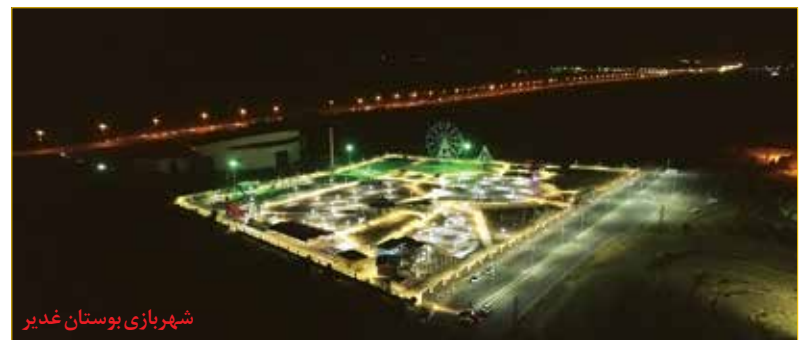
شهرسازی بوستان غدیر