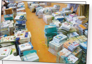
توزیع کتب درسی برای ۲۱۷ هزار دانش آموز در مرکز هیمن صفحه