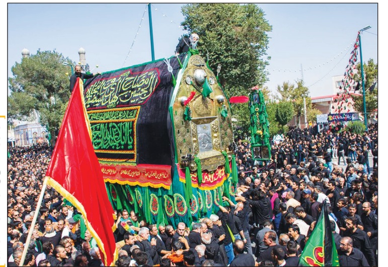
عزاداران حسینی (ع) در سمنان عکس اینرا