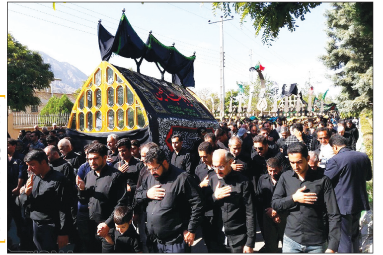
عزاداران حسینی (ع) در مرکزی عکس اینرا

همزمان با عاشورای حسینی عزاداران و محبان اهل بیت (ع) در سراسر کشور ندای «لیک یا حسین (ع) » سر دادند