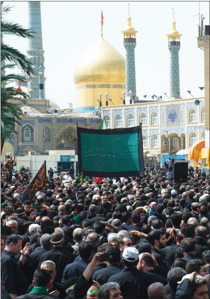
عزاداران حسینی (ع) در قم عکس اینرا