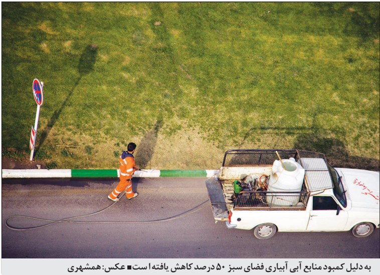
به دلیل کمبود منابع آبی آبیاری فضای سبز ۵۰درصد کاهش یافته است